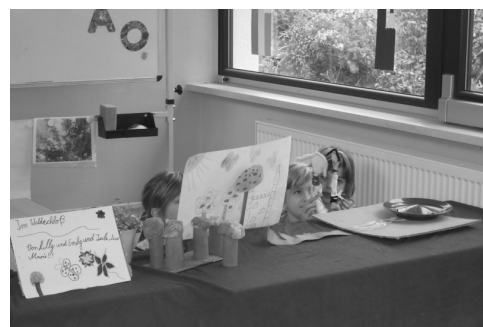
Das Hortteam der Internationalen Grundschule Crinitzberg

Fazit: Es waren Spitzenergebnisse, die Kinder waren begeistert und hoch motiviert. Die Zuschauer verlangten Zugaben und wir planen in der Zukunft weitere Theaterprojekte.